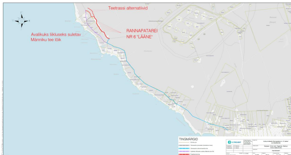
Joonis 1. Projekti asukoht Naissaare edelarannikul.

Käesoleva KMH eelhindangu objektiks on Naissaarel Tagakülas/Bakbyn külas Viimsi metskond 92 maaüksusel (katastriüksus 89001:001:0049) asuvalle kultuurimälestisele Rannapatarei nr. 6 "Lääne" uue juurdepääsutee rajamine. Rannapatarei nr 6 „Lääne“ on aastatel 1912 – 1918 ehitatud Peterburi merekaitse Peeter Suure merekindluse ehitiste osa, vt info välislinkidel: https://register.muinas.ee/public.php?menuID=monument&action=view&id=2642 .