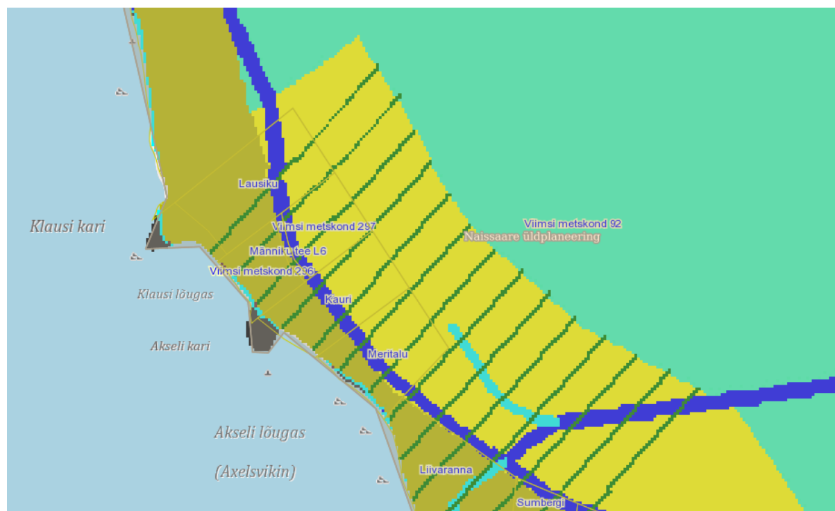
Joonis 3. Naissaare üldplaneeringu kaart.

Projekti piirkonnas on üldplaneeringu kohaselt Väikeheinamaa külas nende kinnistute, millest Männiku teed ümber juhitakse, maakasutuse juhtotstarbeks elamumaa.