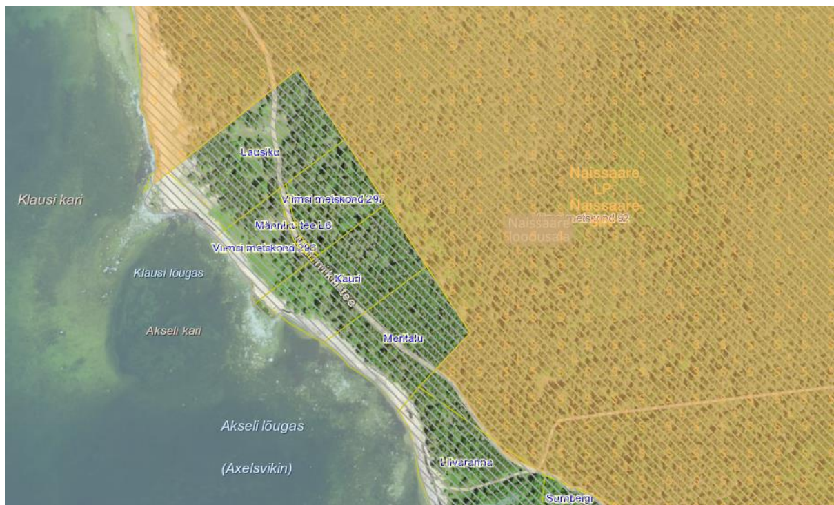
Joonis 4. Natura loodusala paiknemine projektiala suhtes.

Natura 2000 on üle-euroopaline kaitstavate alade võrgustik, mille eesmärk on tagada haruldaste või ohustatud lindude, loomade ja taimede ning nende elupaikade ja kasvukohtade kaitse või vajadusel taastada üle-euroopaliselt ohustatud liikide ja elupaikade soodne seisund. Natura 2000 alade võrgustiku mõte ja sisu on kirjas 1992. aastal vastu võetud Euroopa Liidu loodusdirektiivis (92/43/EMÜ). Sama direktiiviga sätestati Natura võrgustiku osaks ka 1979. aastal jõustunud linnudirektiivi (2009/147/EÜ) alusel valitud linnualad. Natura hindamine on kavandatava tegevuse elluviimisega eeldatavalt kaasneva mõju hindamine Natura 2000 võrgustiku aladele.